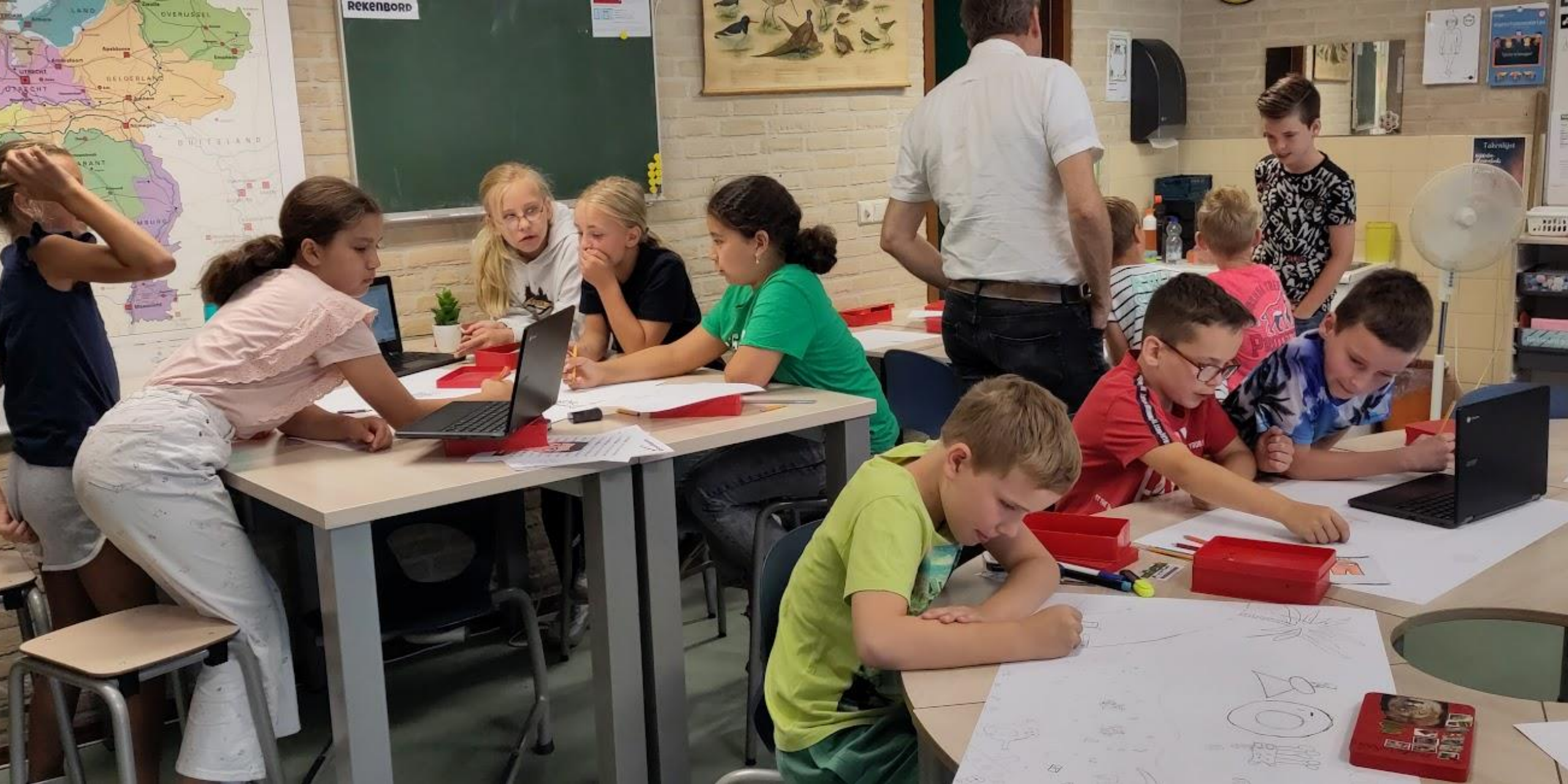
Kinderen De Meander vol inzet aan het tekenen voor de Mozaïekwerken.