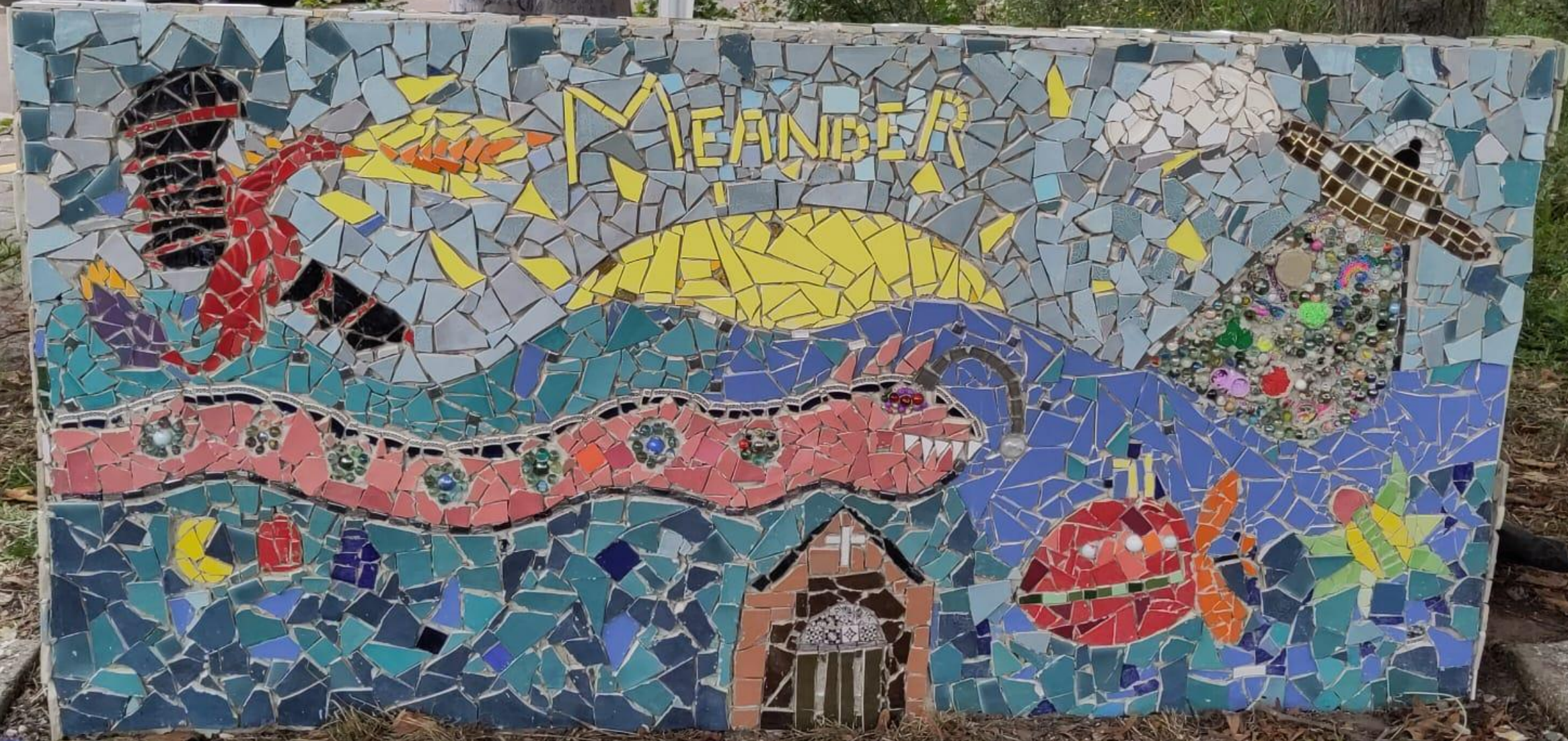
Zuil "De Meander" kant 1 klaar