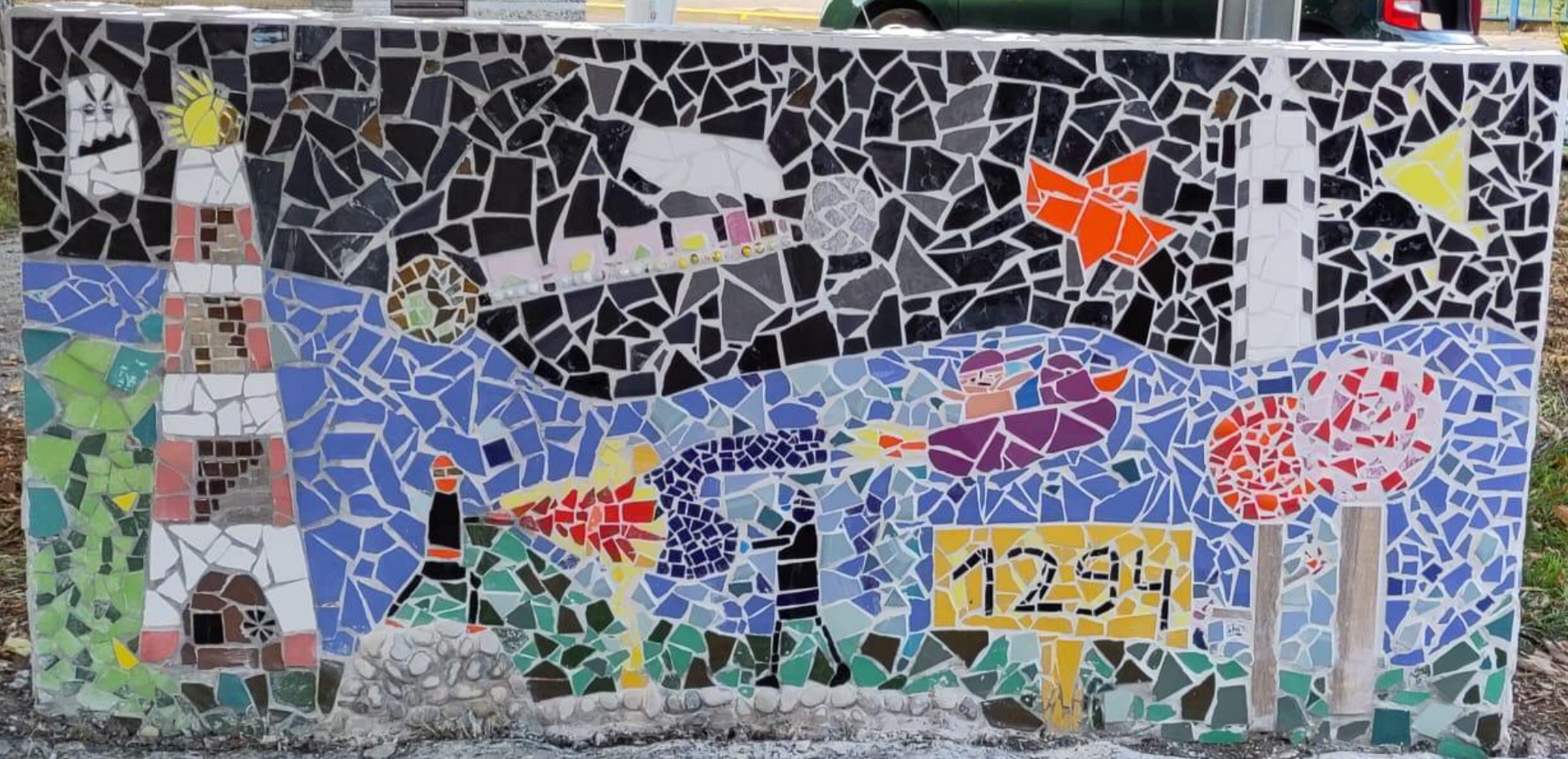
Zuil "De Meander" kant 2 ook klaar