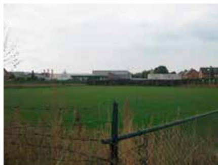
Het trapveldje aan de broeklaan ligt er nog verlaten bij, maar wellicht weldra een kweekvijver van nieuw Offenbeeks talent.