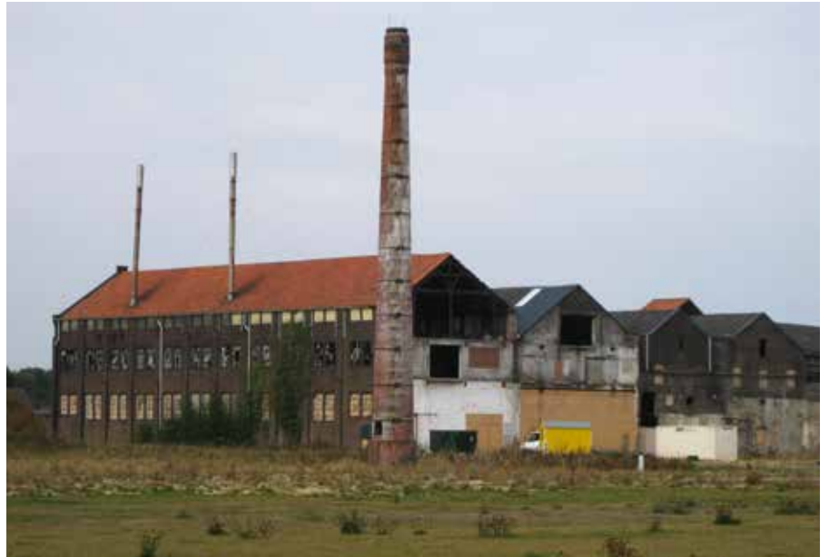
Moelijk te geloven dat hier de komende jaren een school zal verrijzen.