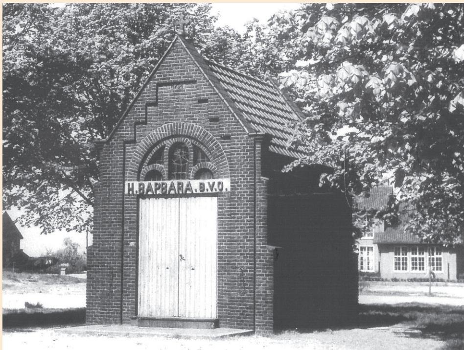
De oude Barbarakapel, die in 1964 werd afgebroken.

De kapel zou het slechts dertig jaar uithouden. Gemeentelijke reconstructies waren er de oorzaak van, dat de kapel in 1964 werd afgebroken. Wellicht zijn door de gemeente toen nog vage toezeggingen gedaan over herbouw van de kapel, maar dat is er niet meer van gekomen.